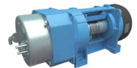
Máxima suavidad al arrancar y parar el ascensor