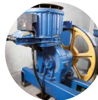
Brusquedad en los arranques y paradas del ascensor