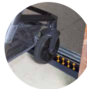
Desnivel entre cabina y el suelo