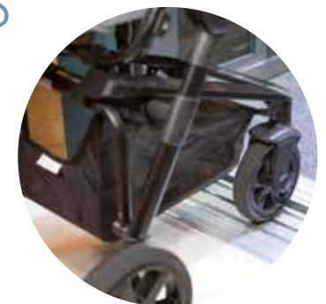
Máxima nivelación, sin escalones